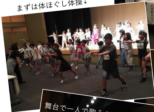
まずは体ほぐし体操↓