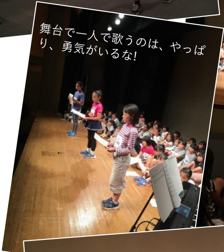
舞台上で一人で歌うのは、やっぱり、勇気がいるな！